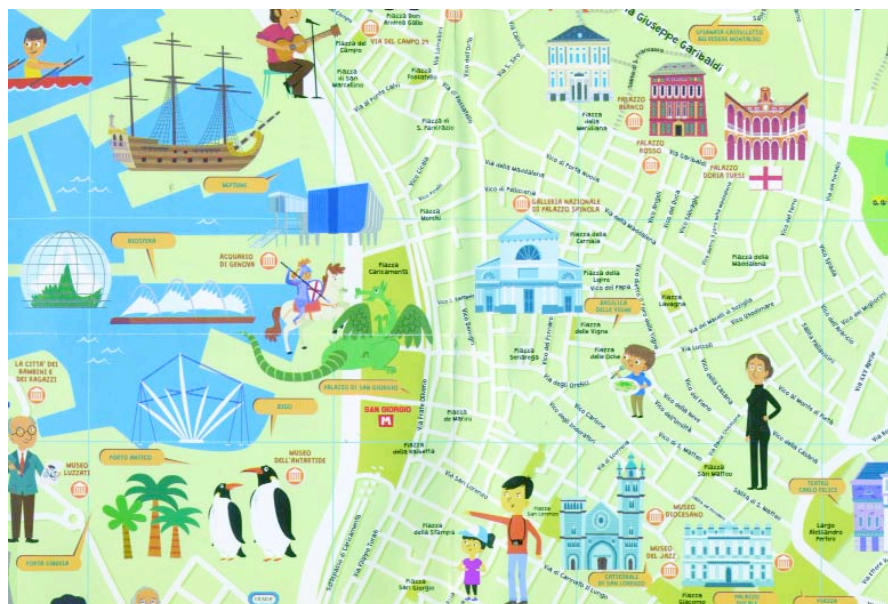
Un particolare da Mappa di Genova, Italy for Kids, 2016 .

Cristina Lubrano, Walter Fochesato - ill. di Giorgia Matarese - foto di Chiara Saitta, GattoNando per Genova , Genova, Fabbrica Musicale, 2016, pp. 96, euro 13,90.